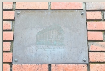
MINNE. Her stod Folkets Hus fra 1914-1972 står det på denne plaketten som henger på veggen til COOP-bygget.