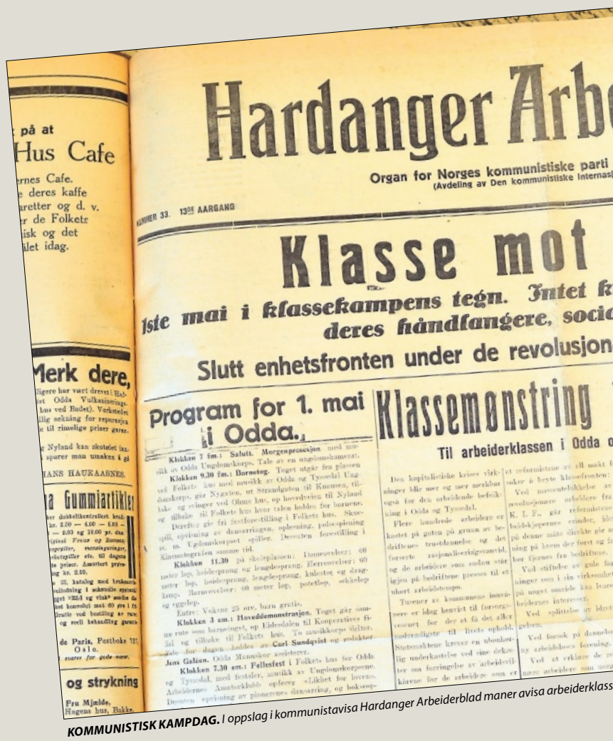
KOMMUNISTISK KAMPDAG. I oppslag i kommunistavisa Hardanger Arbeiderblad maner avisa arbeiderklassen

RENT FYSISK oppsto det slagsmål om en fagfor- eningsfana da to konkurrerende 1. mai-tog møt- tes i Skrevet, der Røldalsvegen møter Kremmar- vege.